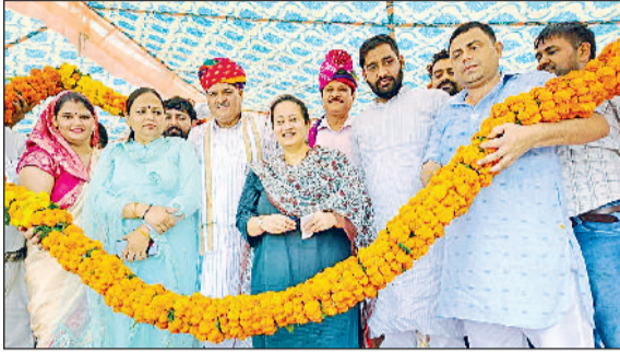
रेवाड़ी। कार्यक्रम में स्वास्थ्य मंत्री व अन्य नेताओं का माला से अभिनंदन करते ग्रामीण व कार्यक्रम में ग्रामीणों को संबोधित करते हुए स्वास्थ्य मंत्री आरती राव।

प्रदेश की स्वास्थ्य मंत्री आरती सिंह राव ने कहा कि राजनीति जनता और जन प्रतिनिधियों के बीच विश्वास का बंधन है। इसमें वही नेता कामयाब होता है, जो जनता का विश्वास हासिल करता है। राव इंद्रजीत सिंह ने पूरे दक्षिणी हरियाणा की जनता का विश्वास हासिल किया है, जिस कारण क्षेत्र की जनता ने भी भाजपा व राव इंद्रजीत सिंह का खुलकर साथ निभाया है। आरती रविवार को गांव गंगाया अहीर में आयोजित कार्यक्रम को संबोधित कर रही थीं। गंगाया अहीर की जनता ने हमेशा भारतीय जनता पार्टी और विशेष रूप से केंद्रीय मंत्री राव इंद्रजीत सिंह जी के साथ कंधे से कंधा मिलाकर उनका साथ दिया है। अटेली की