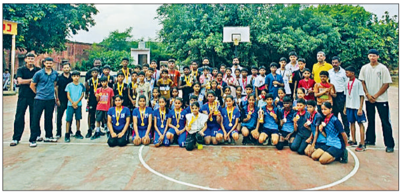
रेवाड़ी। विजेता टीम संघ के पदाधिकारियों व सदस्यों के साथ।

रविवार को आरती राव धन्यवादी दौर के तहत गंगायाचा अहीर गांव में पहुंची थीं। उन्होंने अस्पताल निर्माण के सवाल पर कहा कि शहर के मौजूदा अस्पताल की लगभग 8.5 एकड़ जमीन है। इसी जमीन पर अस्पताल का नए सिरे से निर्माण कराया जा सकता है। इसके लिए लोक निर्माण विभाग अगस्त तैयार होता है, तो इसी जगह जमीन को ऊंचा उठाकर नए भवन का निर्माण कराया जाएगा। उन्होंने सिविल अस्पताल की जमीन को नए अस्पताल निर्माण के लिए सबसे बेहतर व उपयुक्त करार देते हुए नांगल भगवानपुर के धरने को झटका देने का काम कर दिया है।