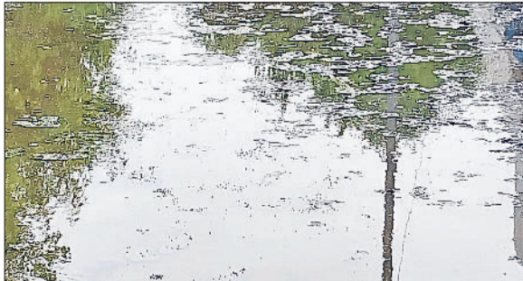
रेवाड़ी। अनाजमंडी में जमा बरसात का पानी।

पिछले दिनों हुई बरसात के बाद जिले के शहरी व ग्रामीण क्षेत्रों में कई जगह जलभराव की स्थिति बनी हुई है, जिससे डेंगू का लावा भी एक्टिव हो गया है। अगस्त माह में लगातार आ रहे डेंगू के मामलों ने स्वास्थ्य विभाग की चिंता बढ़ा दी है। लोगों के लिए भी डेंगू का एडीज मच्छर खतरा बनता जा रहा है निजी व सरकारी