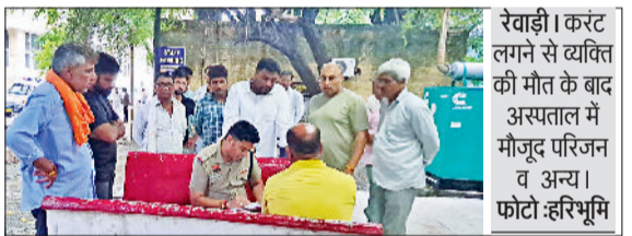
रेवाड़ी। करंट लगने से व्यक्ति की मौत के बाद अस्पताल में मौजूद परिजन व अन्य।