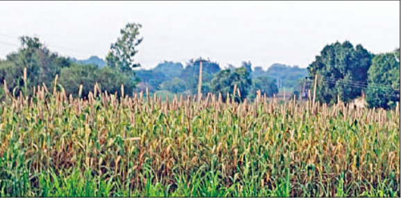
रेवाड़ी। एक खेत में लहलहाती बाजरे की फसल।

आसमान में बादल छाए रहे। बादलों के बीच कुछ परिया में फुवारे भी गिरीं। सुबह लगभग 10 बजे बाद बादल साफ हुए, तो तेज धूप ने एक बार फिर उमस पैदा कर दी। अधिकतम तापमान 0.5 डिग्री सेल्सियस बढ़कर 34.5 डिग्री सेल्सियस दर्ज किया गया। न्यूनतम तापमान भी इतनी ही वृद्धि के साथ 23.0 डिग्री पर पहुंच गया। हवा में नमी का स्तर 80 प्रतिशत तक रहा, जबकि हवा की गति 13 किमी प्रति घंटा रही। दोपहर तक तेज धूप के चलते लोग उमस भरी गर्मी से परेशान रहे। वातावरण में नमी के