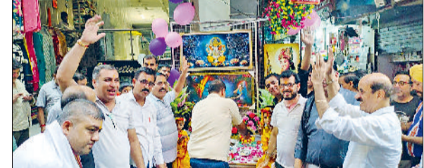
रेवाड़ी। जन्माष्टमी का पर्व मनाते एसोसिएशन के सदस्य।