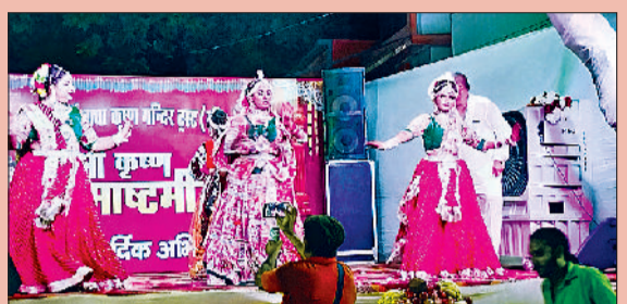
रेवाड़ी। लक्ष्मी नारायण मंदिर में डांस बरती बच्ची व उपस्थित महिलाएं, जन्माष्टमी के पर्व पर अनाजमंडी शिव मंदिर में कान्हा बने बच्चे, बारा हजारी दुर्गा मंदिर में श्रीकृष्ण-सुदामा की झांकी तथा मॉडल टाउन स्थित राधा-कृष्ण मंदिर में कार्यक्रम पेश करते कलाकार।