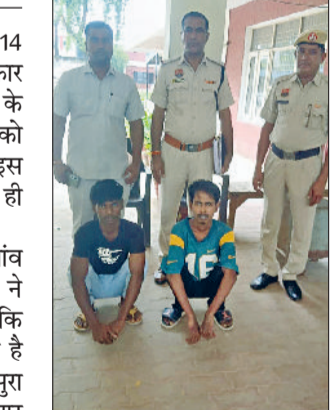
रेवाड़ी। पुलिस गिरफ्त में आरोपी।