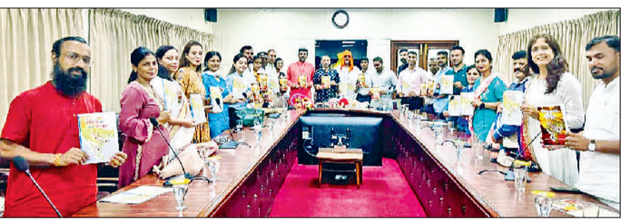
रेवाड़ी। पुस्तक का विमोचन करते योग आचार्य।

पुस्तक के चतुर्थ संस्करण का विमोचन किया गया है। बहुत समय से देश विदेश में इस पुस्तक की अन्य भाषाओं में मांग हो रही थी। पुस्तक को बायोग्राफी ऑफ योगीज नाम से अंग्रेजी भाषा में उपलब्ध कराया गया है। उन्होंने बताया कि अंग्रेजी भाषा के अलावा देश विदेश की अन्य भाषाओं