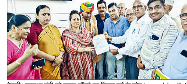
रेवाड़ी। स्वास्थ्य मंत्री को ज्ञापन सौंपते हुए पिछड़ा वर्ग के लोग।