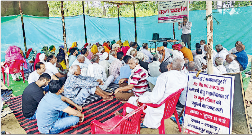
रेवाड़ी। रामगढ़ भगवानपुर में धरने पर बैठे ग्रामीण।

रामगढ़ भगवानपुर में दो माह से सिविल अस्पताल निर्माण की मांग को लेकर चल रहे धरने ने प्रदेश सरकार पर किसी तरह का कोई दबाव बनाने में कामयाबी हासिल नहीं की है। आंदोलन को रविवार को उस समय एक बार फिर झटका लग गया, जबकि प्रदेश की स्वास्थ्य मंत्री आरती सिंह राव ने शहर के मौजूदा अस्पताल की जगह को ही सबसे उपयुक्त बताते हुए इसी जमीन पर नई बिल्डिंग का निर्माण कराने के संकेत दे दिए। केंद्रीय मंत्री राव इंद्रजीत सिंह के साथ टकराव और विरोध की नीति ने रामगढ़ भगवानपुर में अस्पताल निर्माण की संभावनाओं पर लगभग पानी फेर दिया है। रामगढ़ भगवानपुर की पंचायत ने सरकार को वाटर टैंक निर्माण के लिए लगभग 10 एकड़ जमीन दी थी। ग्रामीणों का दावा है कि राव इंद्रजीत सिंह ने पानी की जमीन देने पर इसी गांव में सिविल अस्पताल का