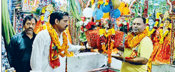
रेवाड़ी। मंदिर में लड्डू गोपाल को झूला झुलाते हुए श्रद्धालु।