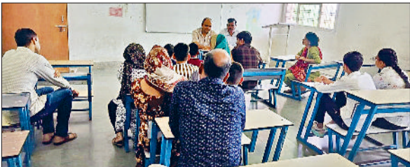
रेवाड़ी। कार्यक्रम में मौजूद शिक्षक व अभिभावक।