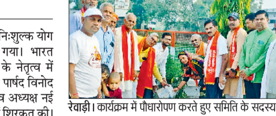
रेवाड़ी। कार्यक्रम में पौधरोपण करते हुए समिति के सदस्य।