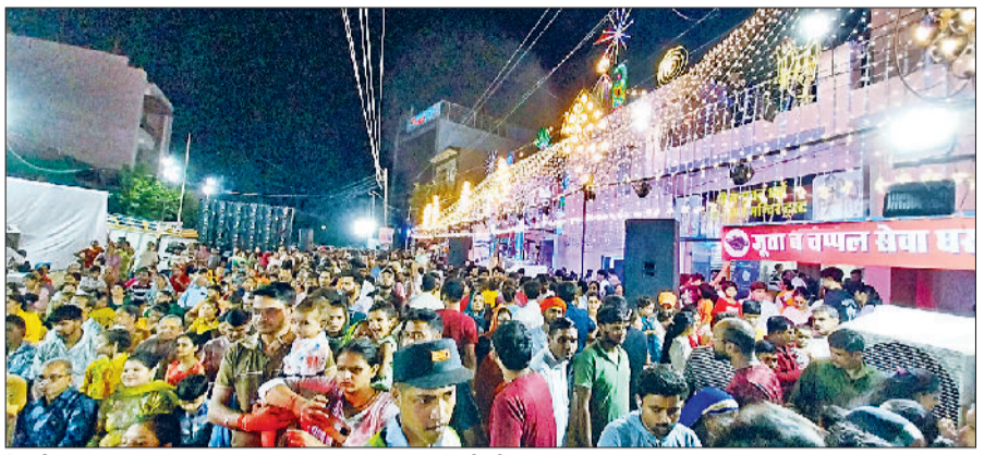
रेवाड़ी। मॉडल टाउन स्थित राधा-कृष्ण मंदिर में श्रद्धालुओं की भीड़।

जिले के मंदिरों में भगवान श्रीकृष्ण जन्माष्टमी पर्व पर शनिवार मध्यरात्रि तक कलाकारों व बच्चों ने राधा-कृष्ण की लीलाओं पर आधारित झांकियों की प्रस्तुति दी। मॉडल टाउन स्थित राधा-कृष्ण मंदिर, मोती चौक घंटेखर महादेव मंदिर, बारा हजारी दुर्गा मंदिर, बारा पत्थर भूतेश्वर महादेव मंदिर, सेक्टर-1 सोलहराही भूतेश्वर मंदिर, सेक्टर-3 राधा-कृष्ण मंदिर,