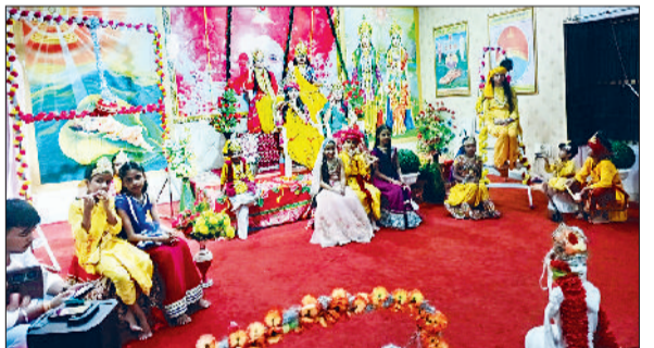
रेवाड़ी। प्रजापिता ब्रह्माकुमारी आश्रम में भगवान श्री कृष्ण की लीला प्रस्तुत करते बाल कलाकार।